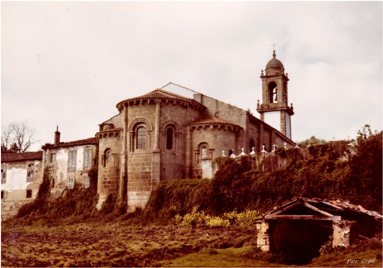
San Martiño do Couto (1973)